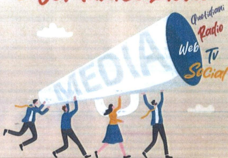
IMMAGINE PUBBLICA ROTARY e Comunicazione