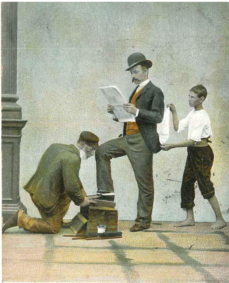
NAPOLI - IL Lustra Scarpe ed il Ladroncello.